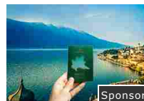
Ritirato e colleziona le tue esperienze in Lombardia