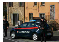
Giovane uccisa a Foggia: bruciata viva - Cronaca